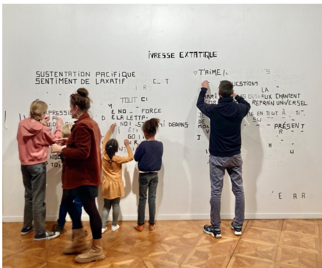
Performance Ecriture Public Gaff et Nous 4x2m Théâtre d'Orléans Scène nationale 2025

La consigne est simple pour créer l'oeuvre, je donne, mets à disposition du gaff d'une certaine largeur au public, ils le découpent eux même à la main, puis le collent sur les traits dessinés à la craie. Le gaff permet de faire une oeuvre qui tient au mur et qui est robuste dans le temps tout en ayant la possibilité de l'enlever à n'importe quel moment sans laisser de trace. Le gaff se déchire aussi assez facilement ce qui permet à tout le monde de participer, ceux qui ont du mal à le découper, je les aide et le public aussi. L'aspect brute, sauvage, visuellement du résultat est voulu, cela donne un côté fait maison, imparfait et lisible facilement, en dehors d'une perfection à atteindre dans la confection de l'oeuvre et cela permet aussi à toutes les tranches d'âge de pouvoir agir. La couleur de gaff que je choisis dépend de l'aspect visuel du support sur laquelle s'écrit le texte, de la thématique aussi, du lieu dans lequel nous nous inscrivons. Une seule couleur est retenue à chaque performance.