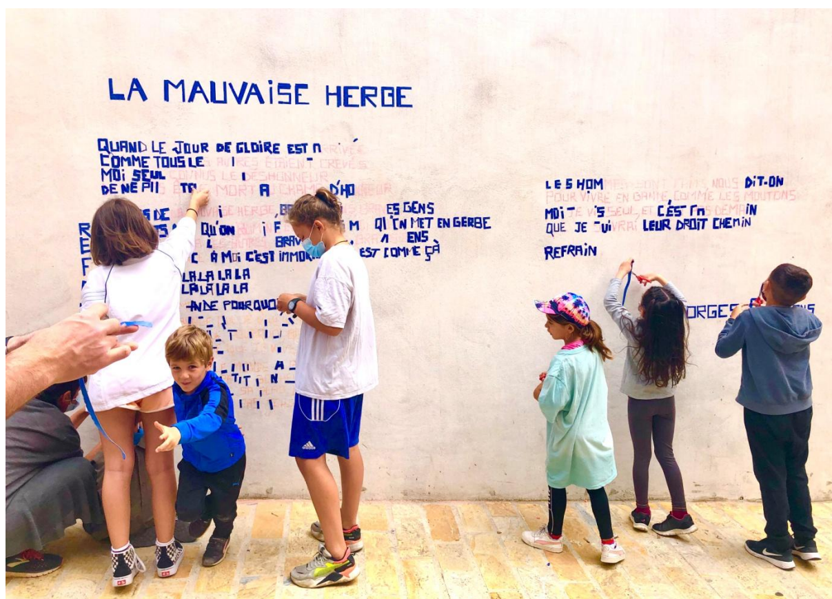
Performance Ecriture Public Gaff et Nous 6x2m Ville de Mèze 2025

Il y a quelques années je me suis mis naturellement à écrire sur les murs ce qui me parle, m'enchant, me fait vibrer. Des festivals de poésie, de philosophie, d'autres événements, m'ont accueilli pour que j'y laisse mes traces intuitives poétiques. Suite à ces expériences artistiques que j'adore, j'ai voulu aussi élaborer en parallèle une performance participative afin de faire collaborer du public à cela, que les gens puissent agir pour créer le texte poétique mural. J'ai plus de dix ans d'expériences dans la création de performances participatives dans l'espace public, et plus d'une dizaine de différentes à mon actif.