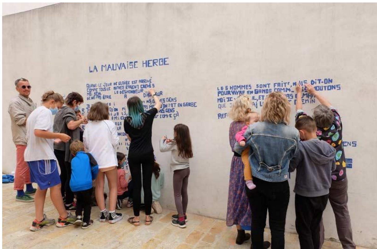
Performance Ecriture Public Gaff et Nous 6x2m Ville de Mèze 2025

Espace poétique et énergétique vibrant Lieu du lien social atypique, partagé et libéré Moment d'expression singulier et improvisé